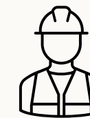
Kønsfordeling på GF2 og Hovedforløb BYG